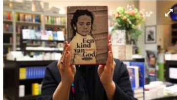
De verhalen in 'Een kind van God' hebben de realiteit als uitgangspunt.

De verhalen in Een kind van God zijn bovendien grotendeels gebaseerd op zaken die ze als advocate in Brussel op haar bord kreeg. "Ik wilde die verhalen niet verloren laten gaan. Ik wil dat men zich realiseert wat sommige mensen meemaken. Ik vind het belangrijk om een gezicht te plakken op verhalen die we alleen uit het nieuws kennen, zaken waar we ons eigenlijk geen voorstelling van kunnen maken."