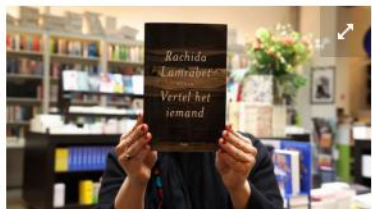
'Vertel het iemand' diept een stuk vergeten geschiedenis op.

de mat geveegd is. Daarom vond ik het belangrijk om dat verhaal - dat een belangrijk deel van onze geschiedenis is - naar boven te halen."