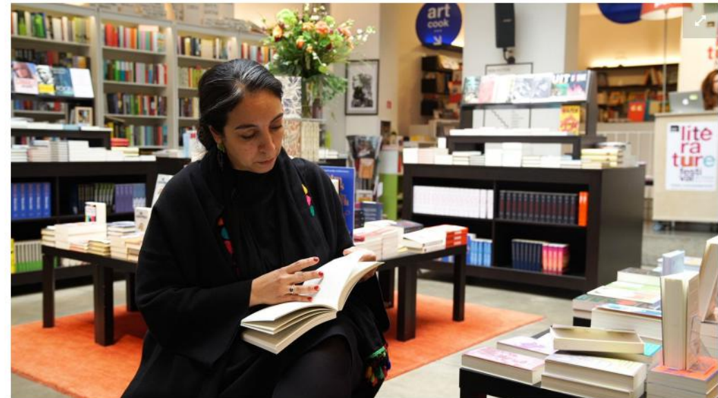
De zoektocht naar de eigen identiteit is een belangrijk onderwerp in het oeuvre van Rachida Lamrabet.