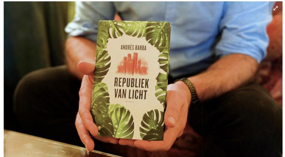
In Republiek van licht verschijnen plotseling 32 kinderen ten tonele die de orde in San Cristóbal verstoren.

In Republiek van licht verschijnen 32 kinderen uit het niets in het stadje San Cristóbal. Ze zijn agressief en verstoren de openbare orde. "Veel volwassenen ontkennen de duistere kant van kinderen. Ze hebben voor zichzelf het beeld geschapen dat kinderen altijd puur en vrolijk zijn. Dat kinderen niet gewelddadig kunnen zijn. Maar dat is fictie en geldt niet voor alle kinderen."