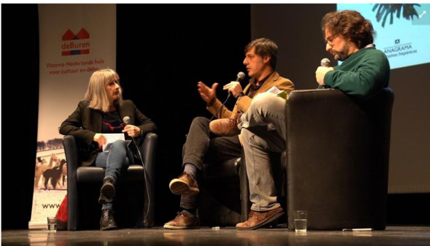
Republiek van licht is een politieke roman over de manier waarop een waarheid geconstrueerd wordt.